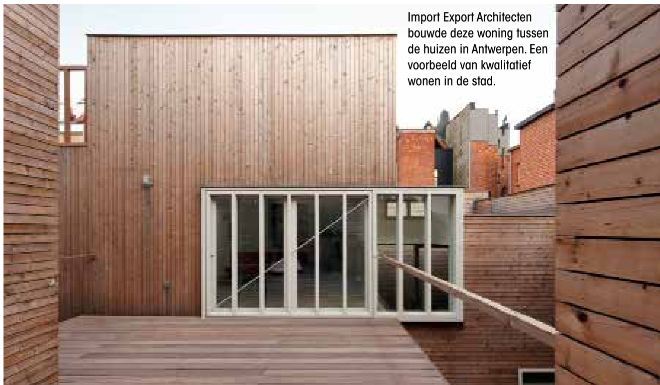
Import Export Architecten bouwde deze woning tussen de huizen in Antwerpen. Een voorbeeld van kwalitatief wonen in de stad.

Intussen heb ik de droom van zo'n huis in een buitenwijk opgeborgen. Ik houd van het feit dat ik maar twintig minuten te fietsen heb om een concert of voorstelling mee te pikken. Dat ik op zondag kan kiezen tussen maar liefst vijf topbakkers voor mijn zondagse pistolets en dat ik in een gezellige buurt woon met straatbarbecues, rommelmarkten en als allergrootste troef een idyllische, ecologische zwemvijver in het park om de hoek. Het idee van zo'n buitenhuis om in de zomer heen te gaan, vind ik top. Die droom neem ik mee naar de toekomst. ■